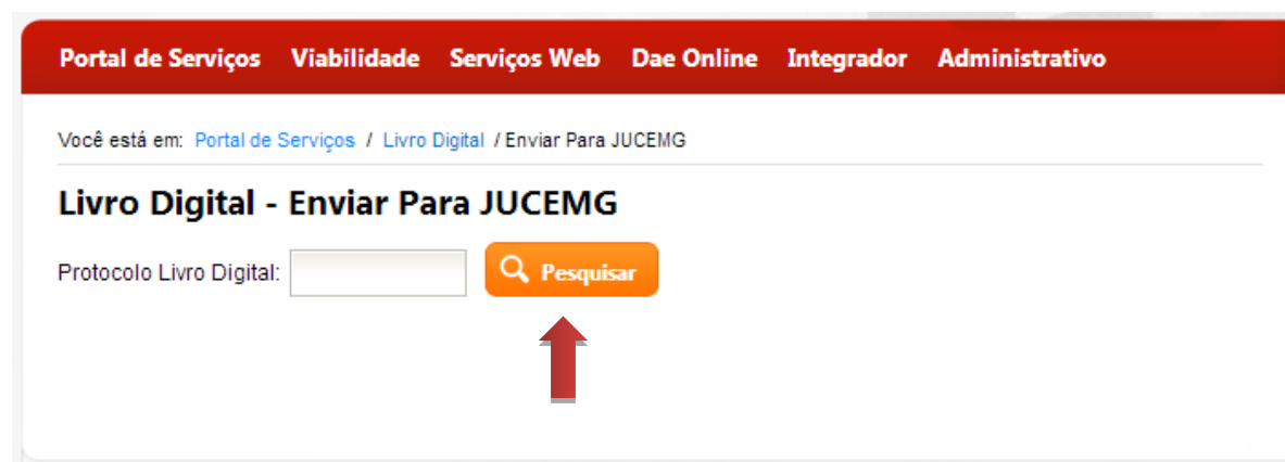
Figura 4: Pesquisar Protocolo Livro Digital