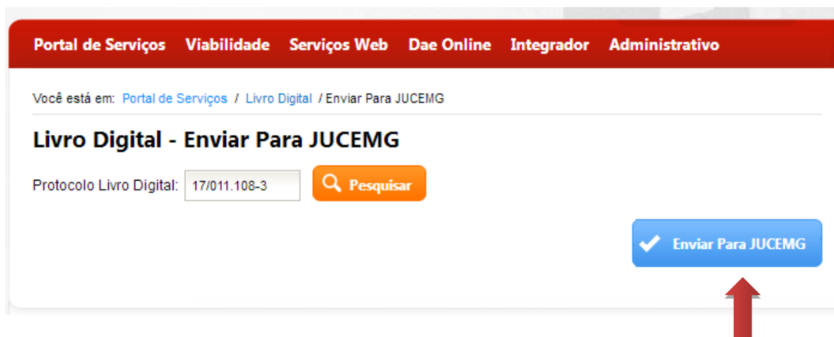
Figura 5: Enviar Livro Digital para Análise da Junta Comercial