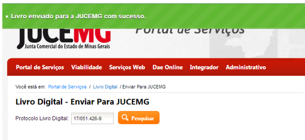
Figura 6: Livro Enviado Para Junta