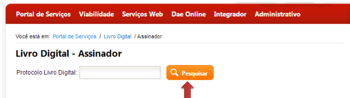
Figura 4: Pesquisar Protocolo Livro Digital