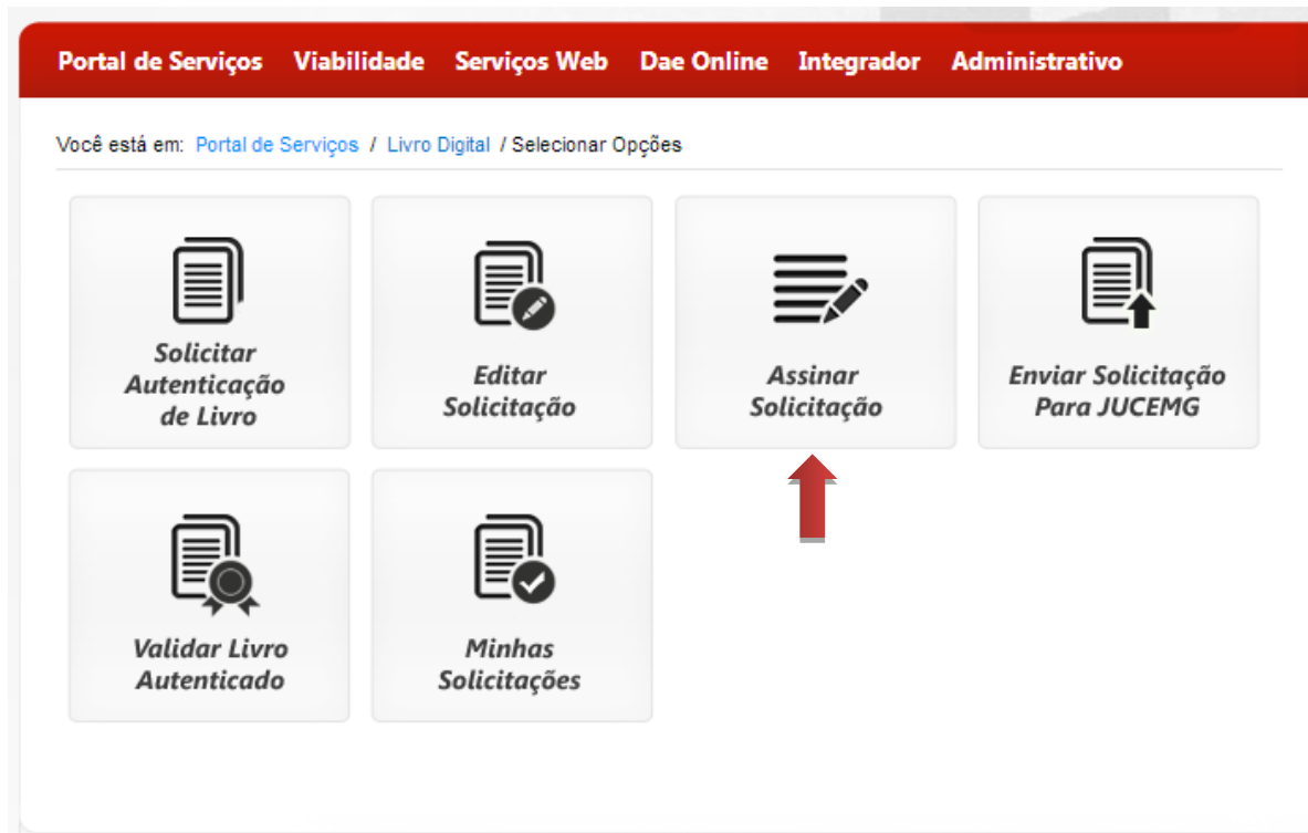
Figura 3: Tela Inicial dos Serviços de Livro Digital