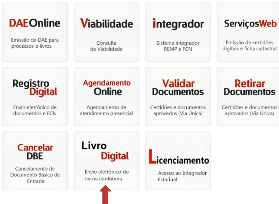
Figura 2: Serviços Disponíveis

Selecione a opção “Livro Digital” para enviar eletronicamente da escrituração das empresas para a Junta Comercial, sendo que essa escrituração deverá ser assinada digitalmente através dos certificados digitais.