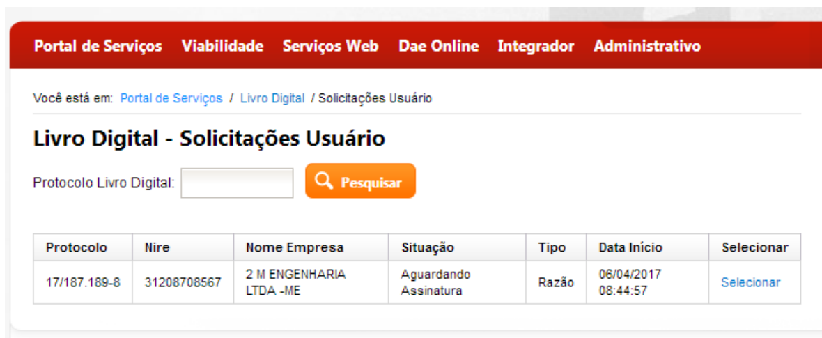
Figura 4: Lista de Solicitações